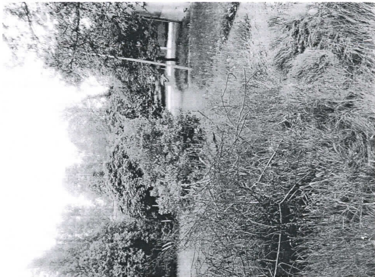
chodník - SOU.