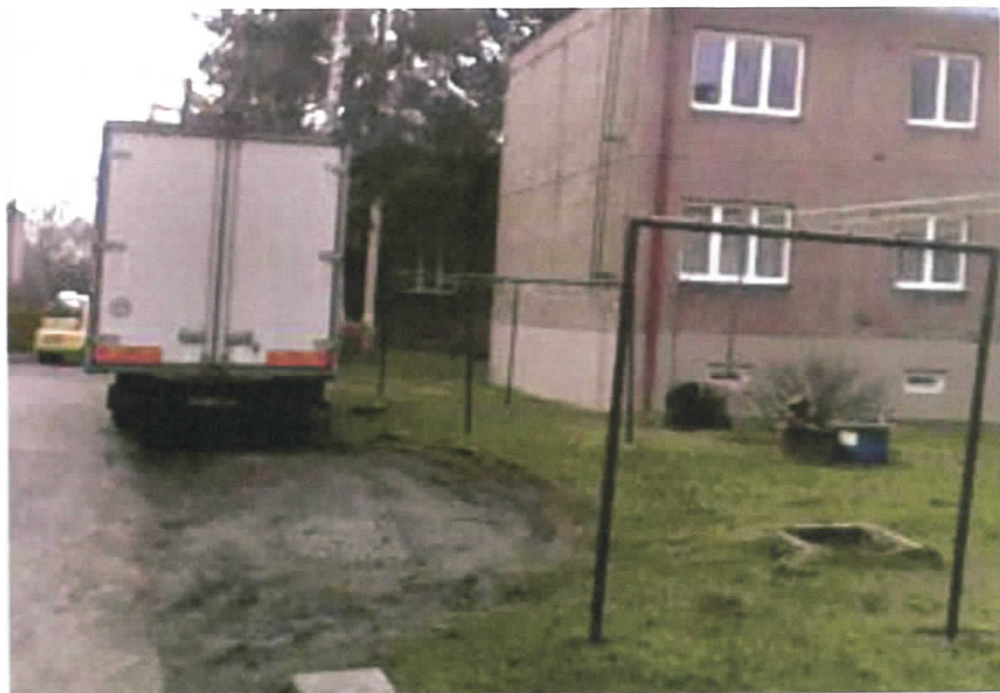
Pančelka 1405/52 - nevhodné parkování na trávě.