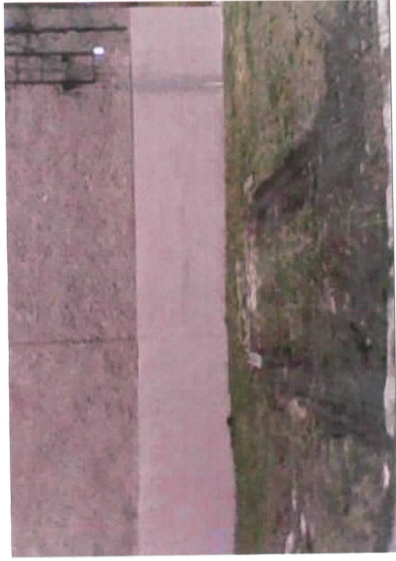
Parkování před domem č. 62 ul. Hornická.