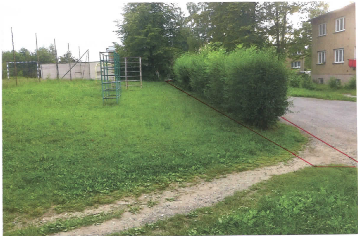
Pančela 1405/76 - zelev - ostatni plocha.