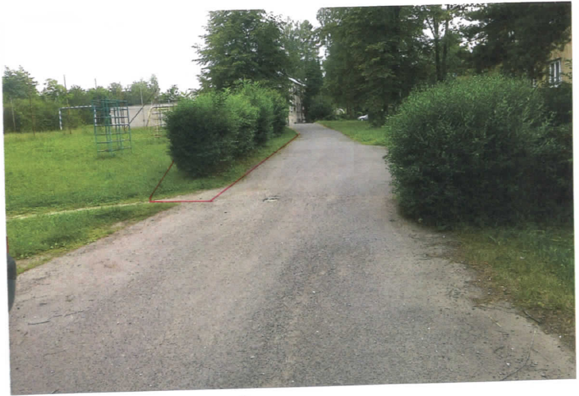
Pančela 1405/77 - komuni kace