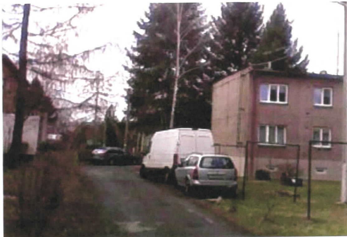
Parkování mezi domy č. 62-64 ulice Hornická po levé straně směrem k ulici Na Pavlasůvce.